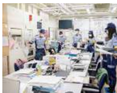
【地域防災無線の確認】