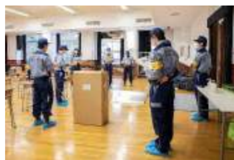
【避難居室設営方法の確認】