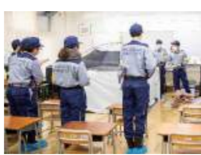
【避難居室設営方法の確認】