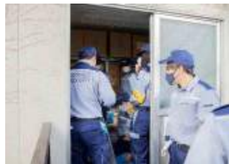
【防災拠点倉庫の確認】