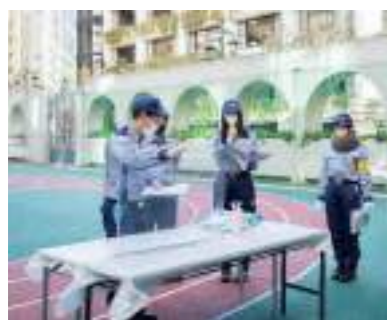
【避難者受入方法の確認】

今年度は、新型コロナウイルス感染症の影響から、令和5年1月28日(土)に区職員のみによる訓練を行いました。