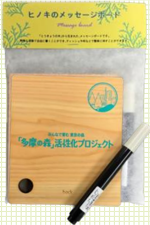
ヒノキのメッセージボード

令和7年度は、協議会事業のPRを目的として「とうきょうの木」(多摩産材スギ又は多摩産材ヒノキ)を活用したノベルティ2種を製作しました！中央区は、区のイベント等で配布予定です。