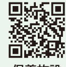
保養施設 予約システム