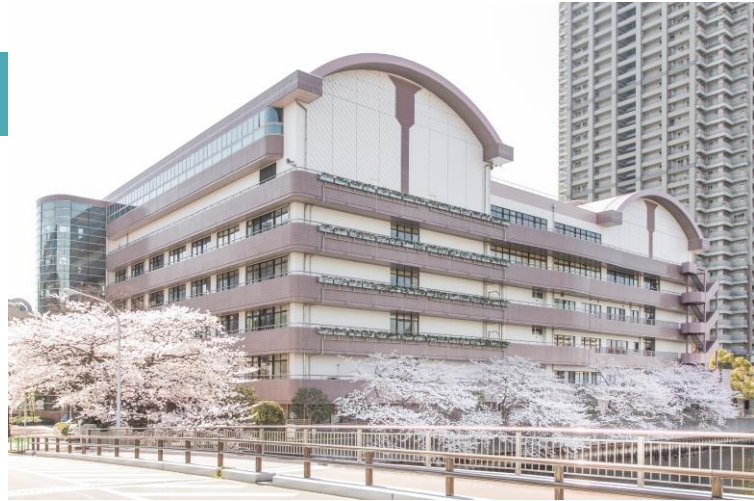
▲現在の晴海中学校校舎