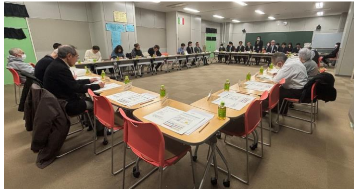
▲ 第1回協議会 当日の様子