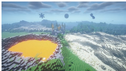
▲教育版マイクラフト