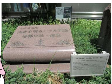
▲運動発祥の地 銀座に設置された記念碑