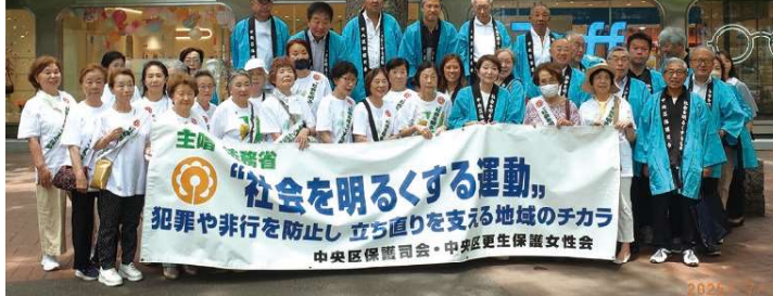
▲数寄屋橋交差点での広報活動

この運動は、犯罪や非行の防止と非行をした人たちの更生について理解を深め、犯罪や非行のない安全で安心な明るい地域社会を築くことを目的とする法務省主催の全国的な運動です。