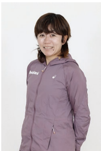
▲ゲストランナー(予定) 野口 みずきさん

問 「区民スポーツの日」実行委員会事務局 (スポーツ課内) ☎(3546)5531 ☎(3546)9561