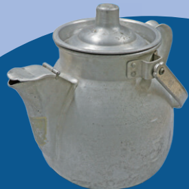
給食用ミルクポット 昭和期 泰明小学校蔵