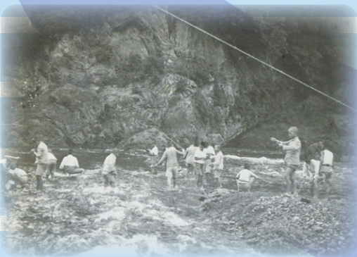
多摩のキャンプ場で釣りをする児童 『夏季施設 キャンプ生活と移動学園アルバム』より 昭和9年(1934)城東小学校蔵