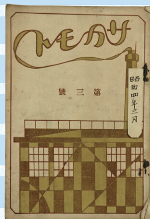
〔サカモト〕第3号（阪本小学校児童保護会発行） 昭和4年（1929） 阪本小学校蔵