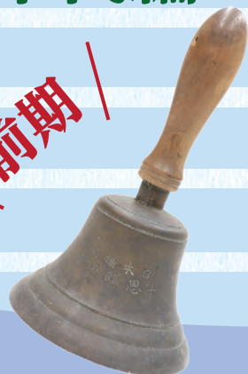
日本橋区十思臨海団 鐘 明治期~昭和初期 日本橋小学校蔵