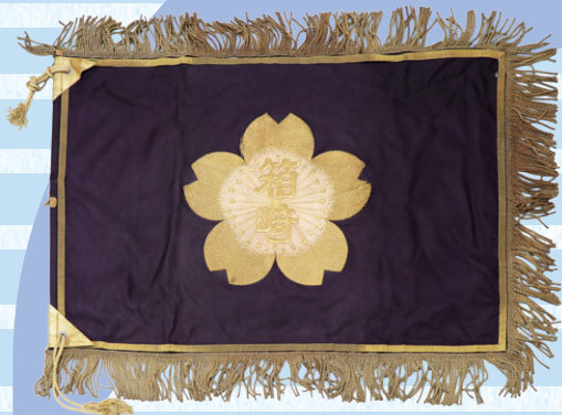
箱崎小学校校旗 大正期~昭和初期 有馬小学校蔵