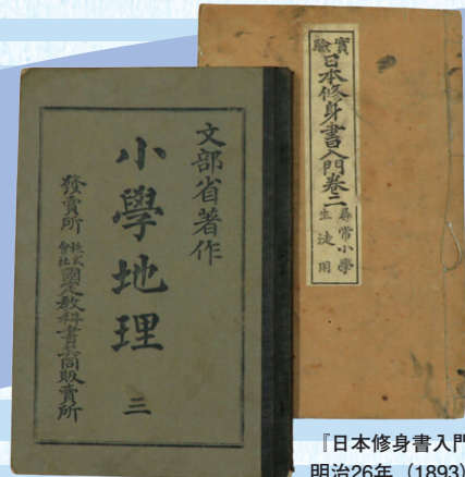
『小学地理 三』 明治38年(1905)泰明小学校蔵