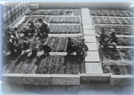
屋上農園での活動 昭和10年代(1935~44)常盤小学校蔵