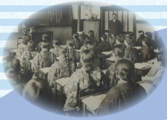
授業を受ける女子児童 『卒業記念写真帖』(大正10年度十思小学校)より 大正11年(1922)日本橋小学校蔵