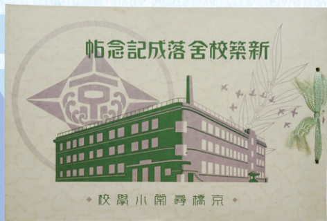
『新築校舎落成記念帖 京橋尋常小学校』 昭和3年(1928)