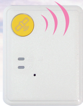
原寸大(縦47.5mm 横38.5mm 厚さ11.85mm)

認知症の症状により行方不明となるおそれのある人の介護者に対し、位置情報探索用のGPS端末を貸与し、認知症のある人の行方不明時にインターネット検索及びコールセンターへの電話での問合せにより位置情報を提供します。また、サービスには認知症のある人を被保険者とする日常生活賠償保険が付帯されています。(委託先:ホームネット株式会社)