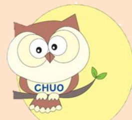
見守りキャラクター マモちゃん

通常業務の中で気づいた高齢者の異変を、お近くの「おとしより相談センター」へご連絡いただくだけです。連絡を受けたおとしより相談センターは、状況を確認し、必要に応じて支援をしていきます。