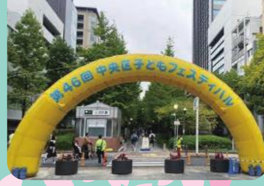
第46回 子どもフェスティバル