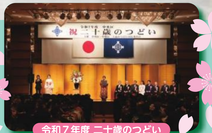
令和7年度 二十歳のつどい