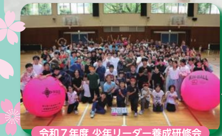
令和7年度 少年リーダー養成研修会