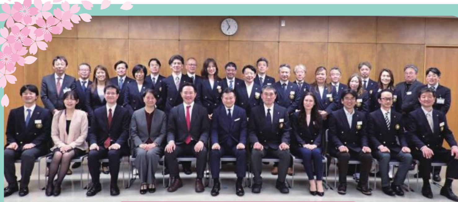
令和8年度 青少年委員委嘱状伝達式