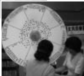
色違いのシール (女性・男性・両方) をそれぞれ貼っていき ます。

ブーケ祭り実行委員会が企画した「 するのは誰ですか？」では、ブーケ祭 り来場者に、家事・育児の性別による役 割分担についてアンケート調査を行いま した。皆さんご自身の生活を改めてふり 返りながら答えてくださいました。 分析結果 ・子育てに関する事は男女が協力 して行っている。 ・料理は女性が圧倒的に多い ・電球の取り替えは男性が多い 結婚当初からの慣例という意見のほか、 得意分野や、時間に余裕のある方が積極 的に担当しているという方もいらっしや いました。 自分の家と他人の家の家事・育児の役 割分担を比較しながら男女が共に分担し ていくためにはどうしたらよいかを考え るきっかけとなりました。