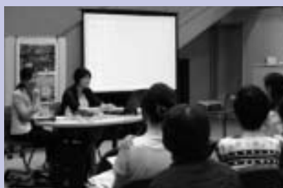
第一回 イブニングトーク それぞれの立場から活発な意見交流がなされました。

8月から偶数月の第1水曜日夜に「水曜イブニングトーク」をブーケ21を会場に開催しています。今年度は「女性とまちづくり」をテーマに各界のゲストをお招きし、お話を伺ったあと、参加者の皆さんもご一緒におしゃべり「ディスカッション」。