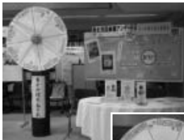
質問が書かれた 手作りの「男女共 同参画の木」。