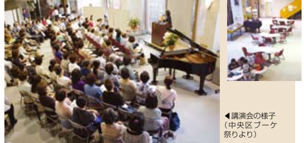
◀講演会の様子(中央区ブーケ祭りより)