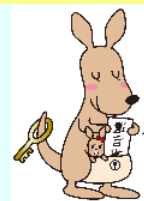
遺言書はかんガル